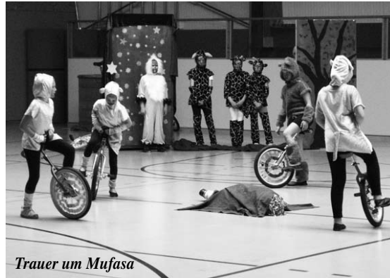
Trauer um Mufasa