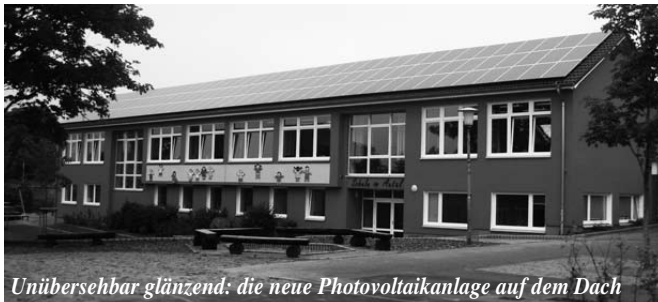
Unübersehbar glänzend: die neue Photovoltaikanlage auf dem Dach

Ende Mai 2010 installierte die Firma Thiesen aus Hürup eine Photovoltaikanlage auf dem Dach der Schule im Aural. Sie besteht aus 117 Platten oder Modulen. Ein Modul ist die Zusammenfassung mehrerer Solarzellen zu einer elektrischen Einheit. Alle Module auf dem Schuldach haben eine Gesamtleistung von 26,32 kWp (Kilowattpeak). Der erzeugte Gleichstrom