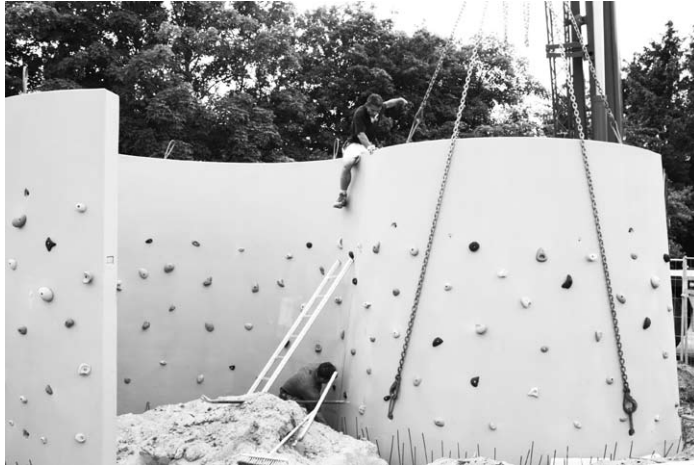
Zum ersten Mal stehen 28 t Beton frei auf dem Fundament

Vor vielen Monaten fanden sich einige Aktive aus der Jugend- und Kommunalarbeit zur „Arbeitsgruppe Abenteuerspielplatz“ zusammen. Beweggrund war der Mangel an „Spielplätzen“, auf denen sich Kinder und Jugendliche erproben können und die Tatsache, dass Kinderspielplätze immer nur für Kinder und mit Ausnahme von Bolzplätzen, ausdrücklich nicht für Jugendliche bereitgehalten werden. Aber auch Jugendliche suchen Plätze „zum Spielen“, um sich nicht langweilen zu