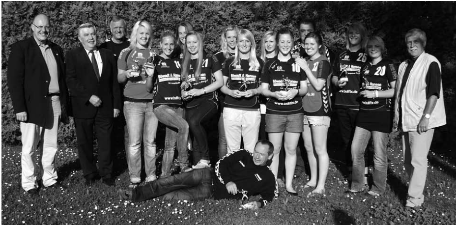
Gruppenfoto der Deutschen Meister 2010