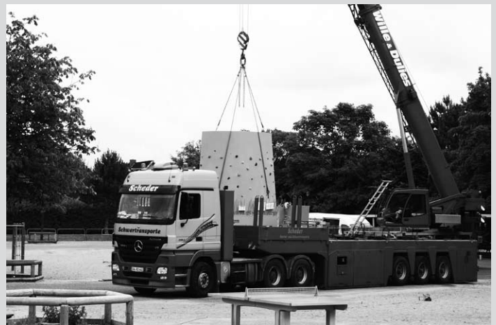
Der Koloss wird in Position gebracht

Die nächste derartige Anlage steht in Schleswig. Sonst ist weit und breit keine vergleichbare öffentliche Freikletteranlage zu finden. Wir hoffen, ihr nehmt die Anlage an und freut euch über dieses, für die Gemeinde Tarp kostspielige Angebot.