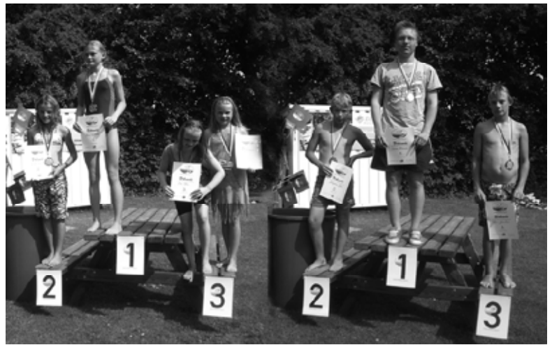
Die Sieger der Mädchengruppe und der Jungengruppe