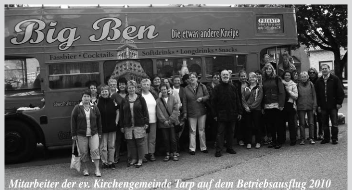
Mitarbeiter der ev. Kirchengemeinde Tarp auf dem Betriebsausflug 2010

In Tarp wieder angekommen hatten wir abschließend „Im Wiesengrund“ beim gemütlichen Grillabend unseren diesjährigen „Betriebsausflug“ aus-