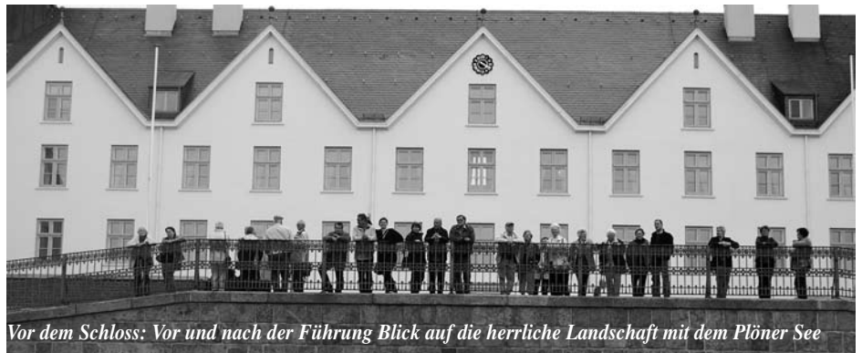
Vor dem Schloss: Vor und nach der Führung Blick auf die herrliche Landschaft mit dem Plöner See

Anschließend wurden wir für die Besichtigung des