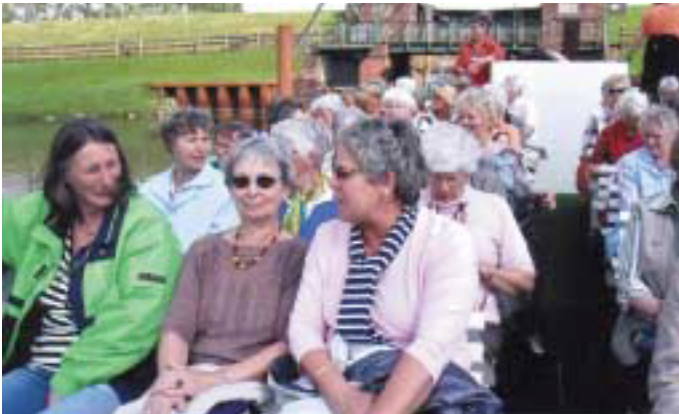
Landfrauen bei einer „Aukieker-Fahrt“ auf der Wilster Au

A us diesem Anlass wurde am 26. Juni mit den Mitgliedern, Ehrengästen und einem Festprogramm im Bilschau-Krug gefeiert. Die 2. Jubiläumsveranstaltung findet dann am 7. Juli statt mit einem Essen im Hotel Steigenberger in Hamburg und der Aufführung des Musicals „Wi rockt op platt - Episode twee“ im Ohnsorg-Theater.