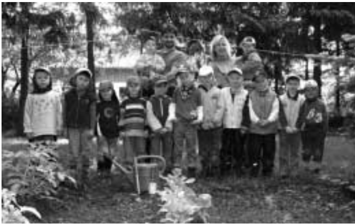
Im Garten wächst es extra für die Kinder vom Waldkindergarten

Infos zum Waldkindergarten Tarp bei der Vorsitzenden Brunhilde Eberle unter 04638/7191 oder www.tarp.de/waldkindergarten .