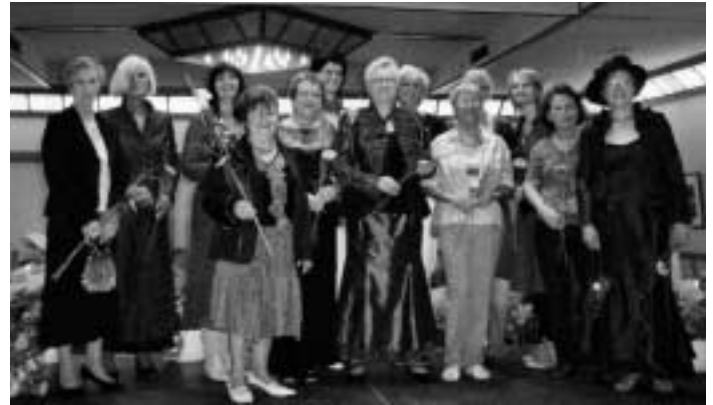
...mit Messen ▼