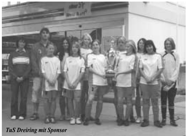
TuS Dreiring mit Sponsor