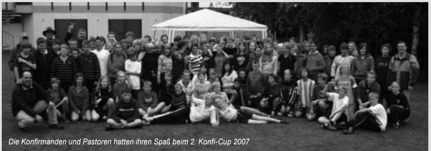
Die Konfirmanden und Pastoren hatten ihren Spaß beim 2. Konfi-Cup 2007