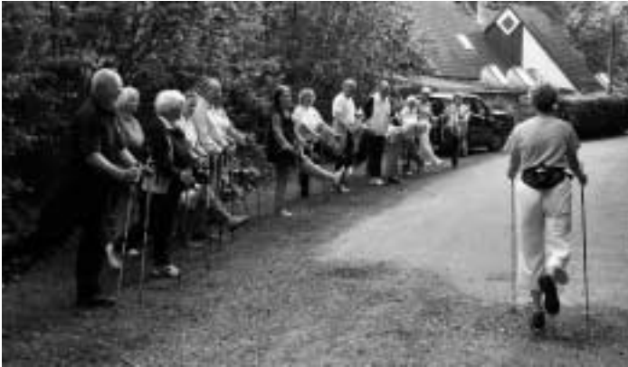
...mit Sport ▲