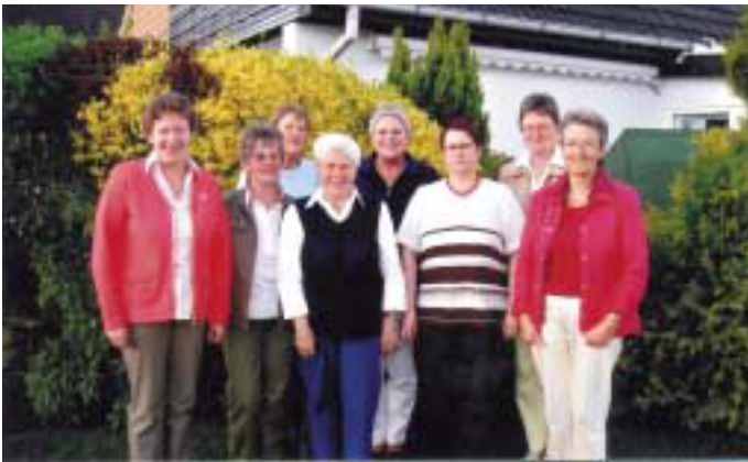
Der Vorstand der Sankelmarker Landfrauen