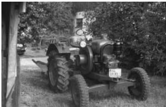
Foto unten: Das älteste Fahrzeug ein KAEBLE-ALLGAIER, Typ A 22, 1951 hergestellt in Backnang in Baden-Württemberg mit Wasserverdampfer als Kühlung, damals einer der preiswertesten Schlepper

Foto oben: Demonstration des Pflügens mit alten Schleppern: vorne links ein FORDSON, vorne rechts ein FERGUSON, MF 35, beide aus den 1960-er Jahren aus England, im Hintergrund links ein McCORMICK und rechts ein INTERNATIONAL HARVESTER COMPANY, IHC 423, beide mit amerikanischem Patent Ende der 1960-er Jahre in Deutschland gebaut.