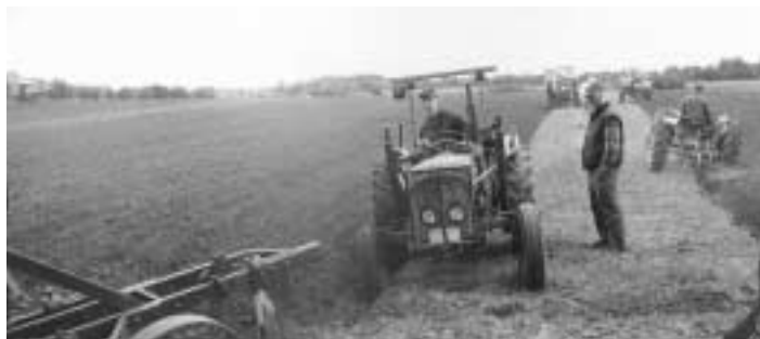
Foto oben: Demonstration des Pflügens mit alten Schleppern: vorne links ein FORDSON, vorne rechts ein FERGUSON, MF 35, beide aus den 1960-er Jahren aus England, im Hintergrund links ein McCORMICK und rechts ein INTERNATIONAL HARVESTER COMPANY, IHC 423, beide mit amerikanischem Patent Ende der 1960-er Jahre in Deutschland gebaut.