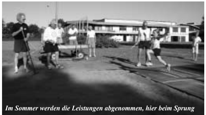
Im Sommer werden die Leistungen abgenommen, hier beim Sprung