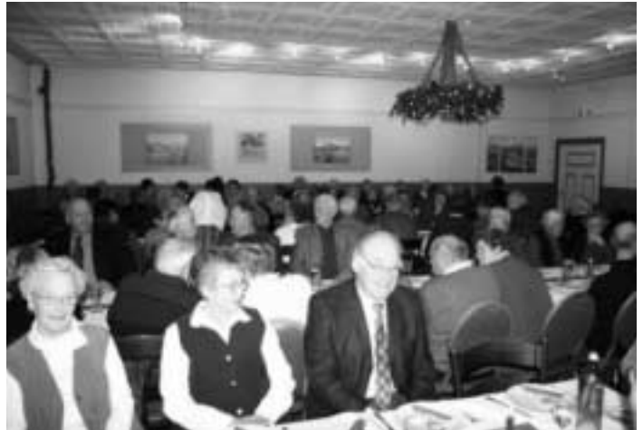
Das Publikum im vollbesetzten Saal folgt aufmerksam dem Geschehen