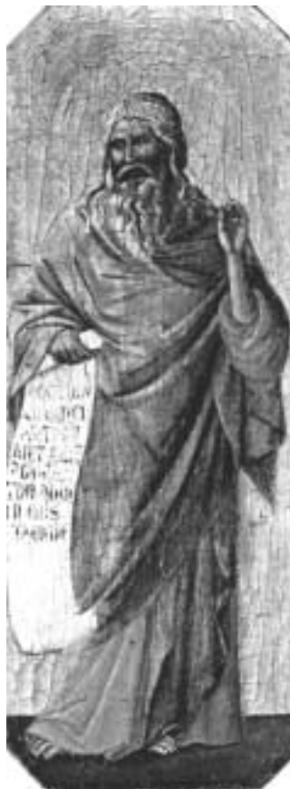
Abbildung: Duccio di Buoninsegna: Maestà, Altarretabel des Sieneser Doms, Prophet Jesaja, 1308-1311, Tempera auf Holz, 43 x 16 cm.