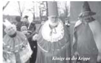
Könige an der Krippe