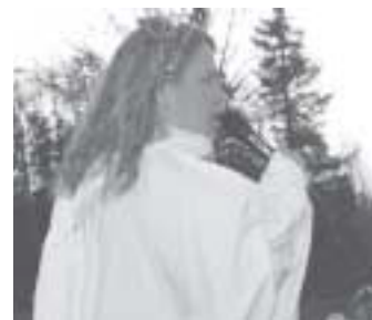
Der Engel verkündigt die Weihnachtsbotschaft: „Euch ist heute der Heiland geboren!“

Helfen auch Sie, indem Sie Ihre gute gebrauchte Kleidung und tragfähige Schuhe der Sammlung für Bethel spenden. Für Ihre Unterstützung danken wir Ihnen im Namen der v. Bodelschwingsche Anstalten Bethel.