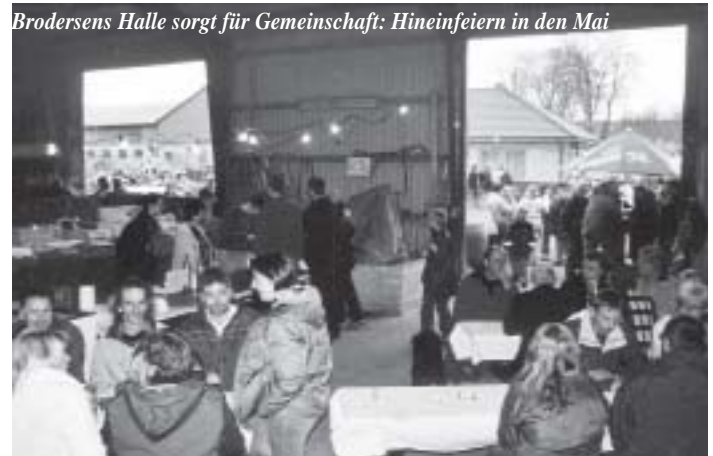
Brodersens Halle sorgt für Gemeinschaft: Hineinfeiern in den Mai