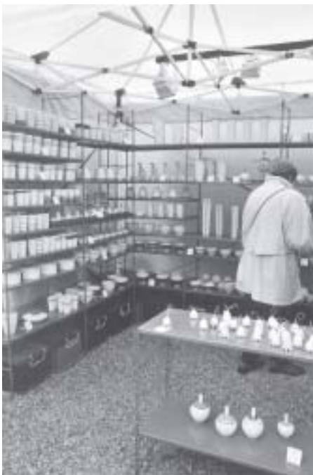
... klar und nüchtern die Farben und Formen der Porzellanmanufaktur Heike und Ulrich Raupach aus Peritz.