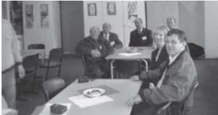
Vorn rechts Bürgermeister Andrzej Kurzatowski

Kürzlich weilte eine Delegation aus der Partnergemeinde der Ämter Eggebek und Oeversee zu Besuch in den Ämtern. Zum reichhaltigen Besuchsprogramm gehörten Besuche der Kindergärten in Tarp, des Schulzentrums in Tarp, der Firmen Hahn Abfüllanlagen, Tarp, Treenetaler, Tarp, N. Thomsen, Tarp. Schließlich gab es auch ein Treffen mit Jugendlichen im Jugendfreizeithaus, mit Vertretern der Tourismusbranche und des deutsch-dänischen Regionalkontors in Bov / DK.