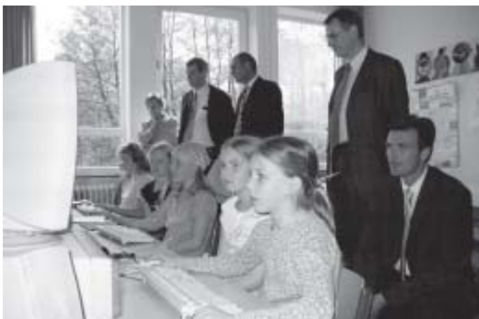
Kinder arbeiten konzentriert am Computer