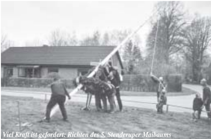
Viel Kraft ist gefordert: Richten des 5. Stenderuper Maibaums

Die geplante Fahrt nach Ostfriesland vom 9. - 12. August 2005 kann aufgrund zu geringer Beteiligung nicht stattfinden. Der Vorstand bedauert sehr, diese Absage erteilen zu müssen.