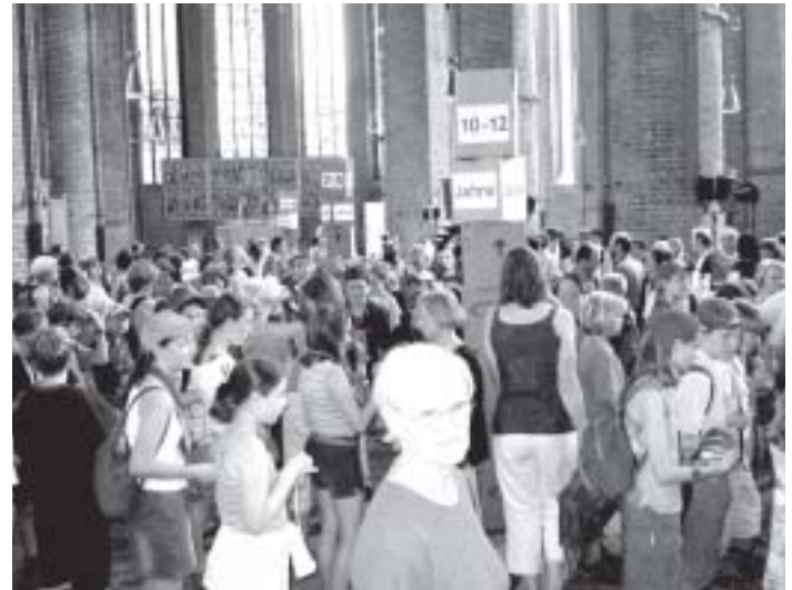
„Kirchenpädagogik“ nannte sich eines der sehr gut besuchten Programmpunkte für Kinder in der Hannoveraner Marktkirche. Trotz der vielen teilnehmenden Kinder samt der sie begleitenden Erwachsenen konnte jeder den Kirchenraum für sich entdecken.